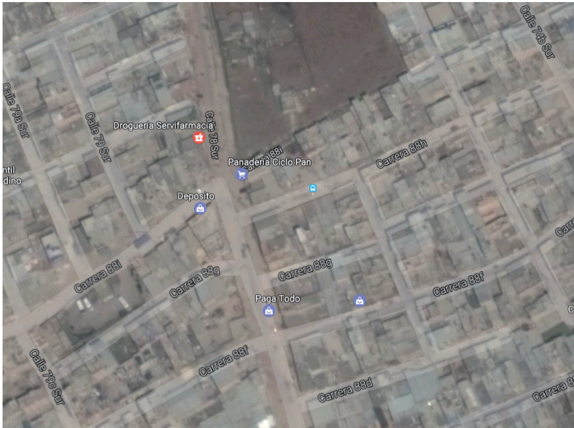
Punto 5: Carrera 87 i con Calle 76 bis Sur