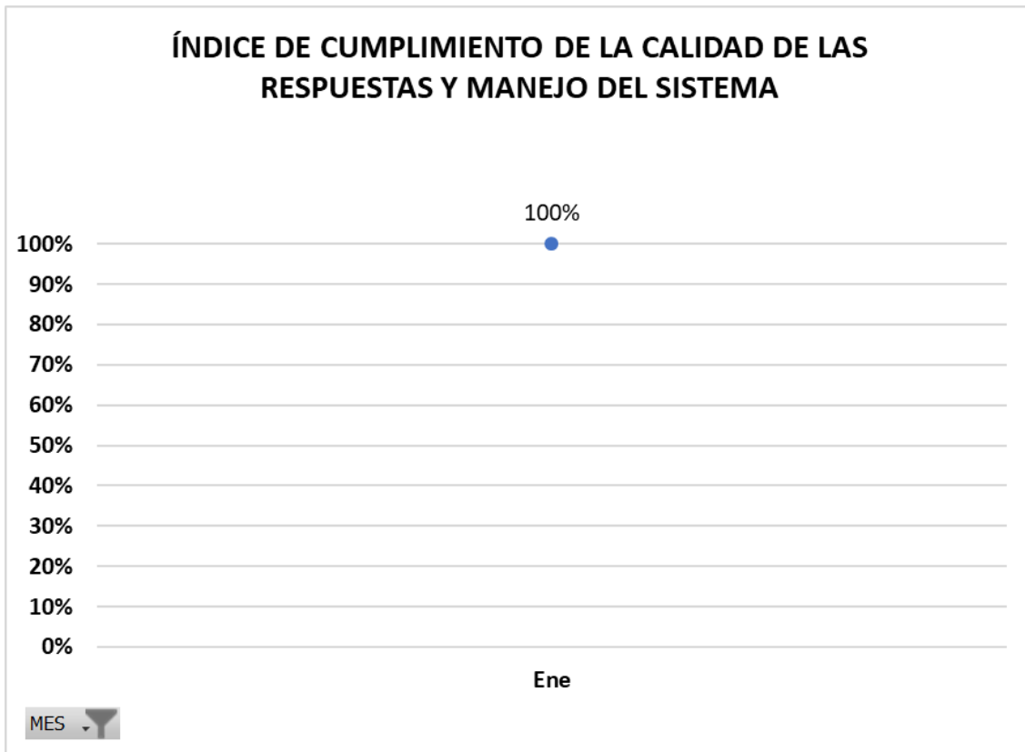
Fuente: Evaluación mensual de calidad y oportunidad

En la siguiente tabla, se relacionan los respectivos porcentajes de cumplimiento y de no cumplimiento discriminado por criterio: