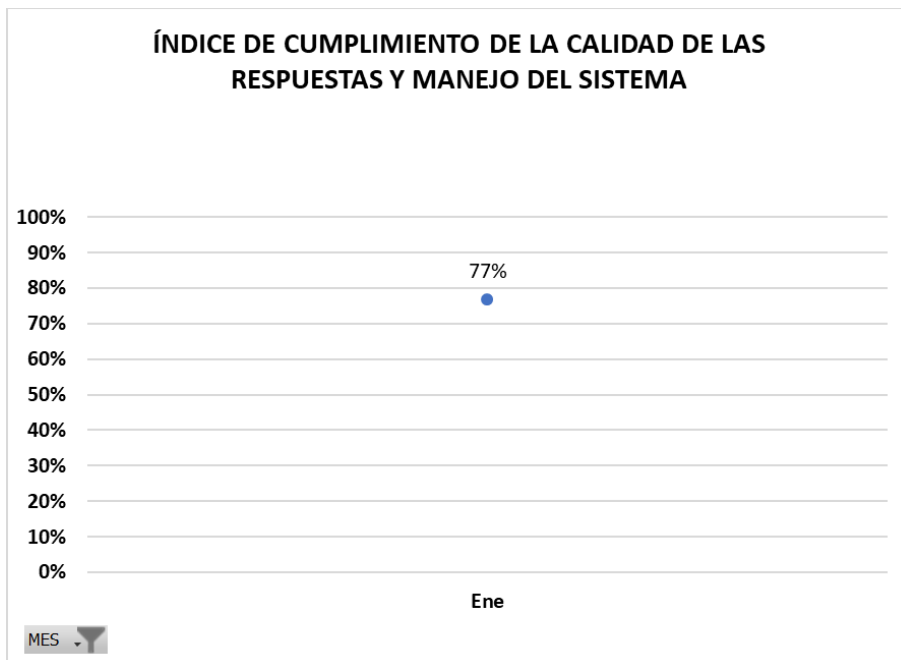
Fuente: Evaluación mensual de calidad y oportunidad

En la siguiente tabla, se relacionan los respectivos porcentajes de cumplimiento y de no cumplimiento discriminado por criterio: