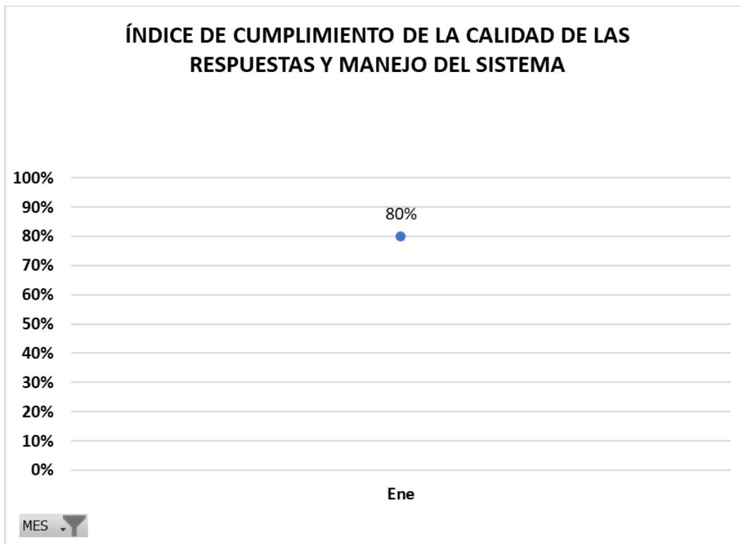
Fuente: Evaluación mensual de calidad y oportunidad

En la siguiente tabla, se relacionan los respectivos porcentajes de cumplimiento y de no cumplimiento discriminado por criterio: