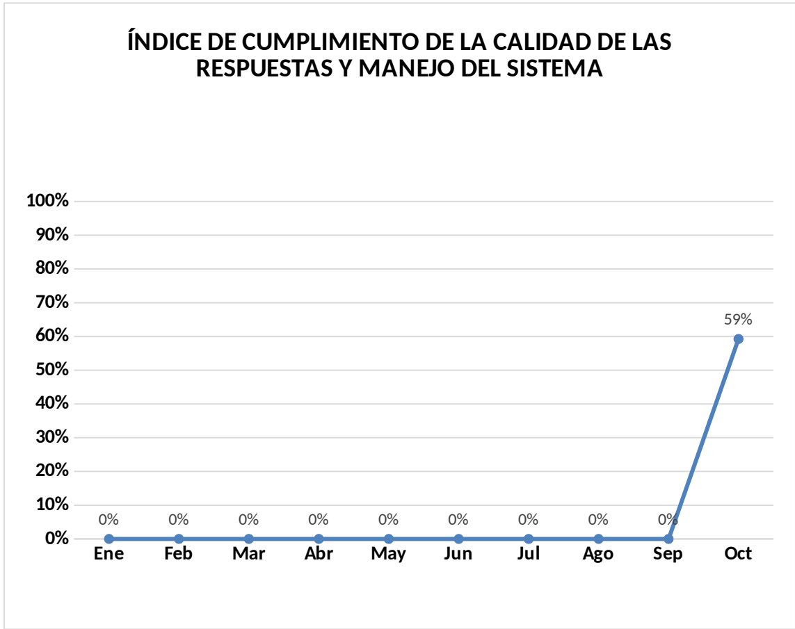
Fuente: Evaluación mensual de calidad y oportunidad