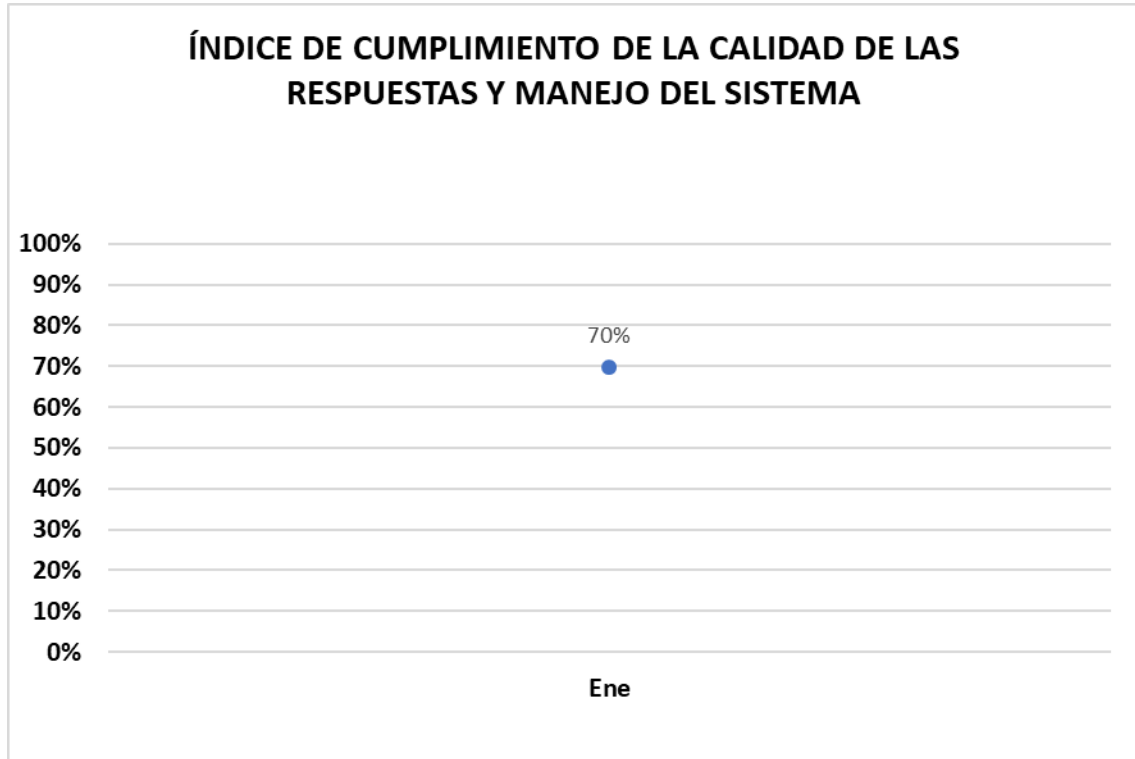
Fuente: Evaluación mensual de calidad y oportunidad