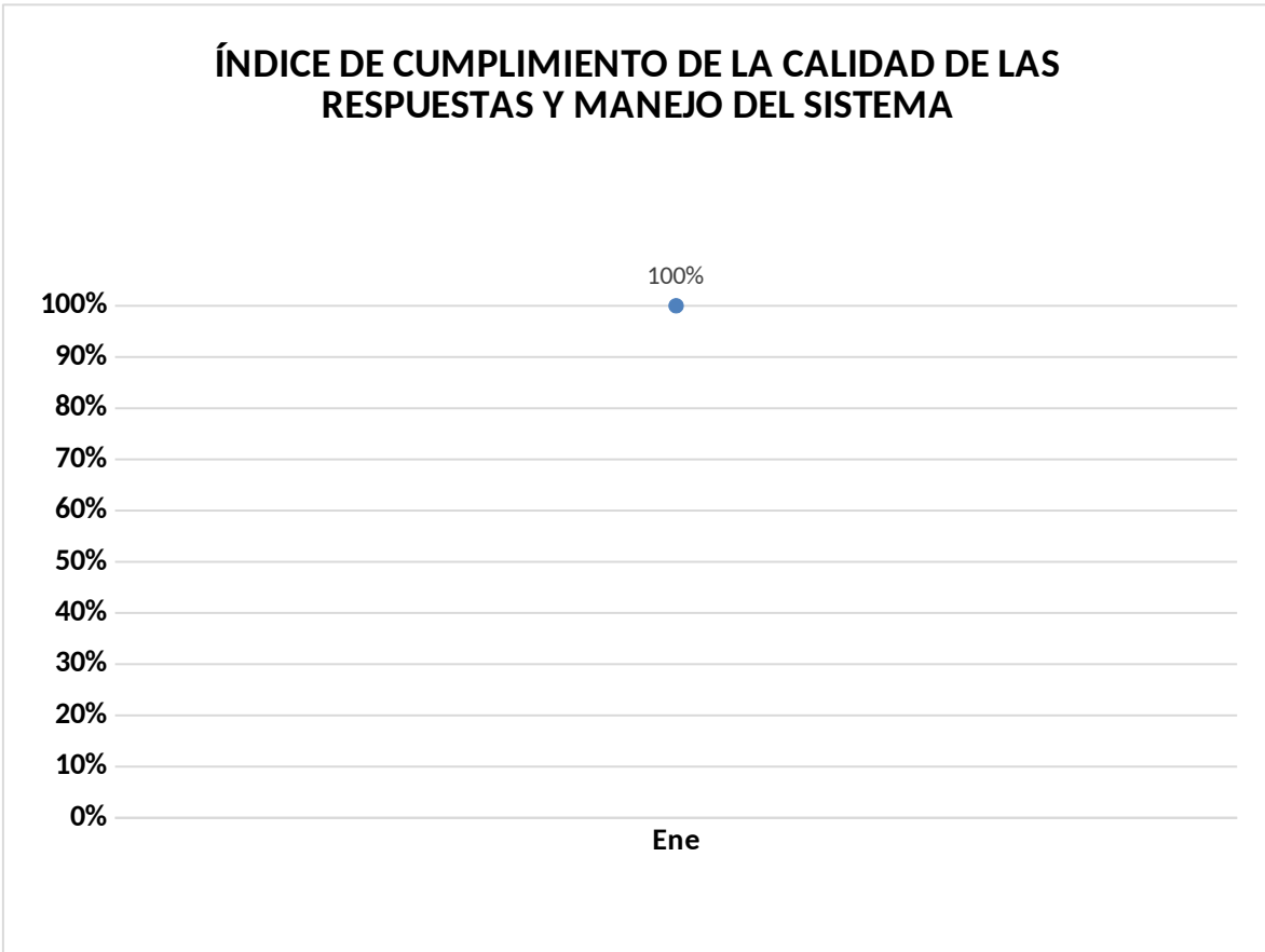
Fuente: Evaluación mensual de calidad y oportunidad