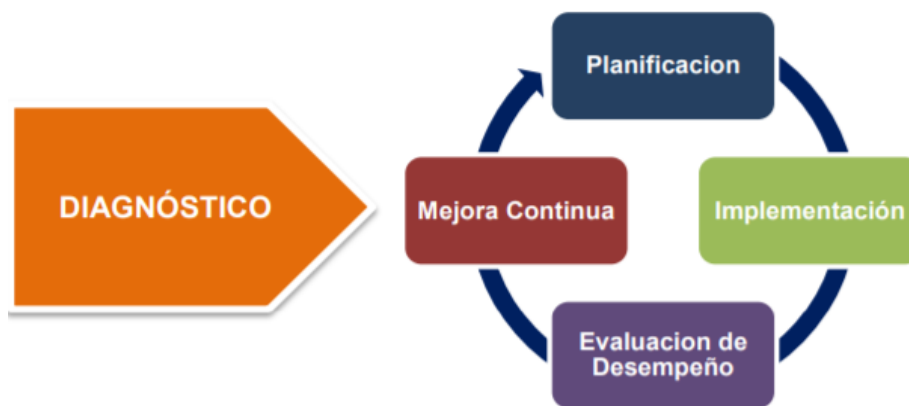
Ilustración 2. Ciclo de vida de operación del Sistema de Gestión de Seguridad de la Información – SGSI