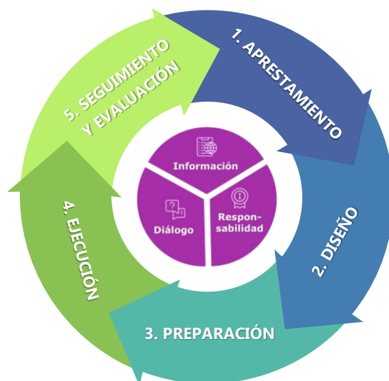
Gráfica 1. Etapas del proceso de Rendición de Cuentas