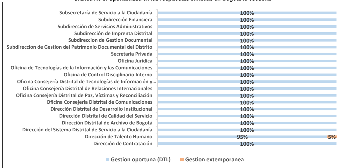
Gráfica No 3. Oportunidad en las respuestas emitidas en Bogotá te escucha