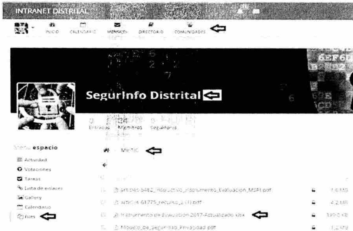
Figura 2. Descarga de plantillas Modelo de Seguridad y Privacidad de la Información.

Contamos con su amable participación, y esperamos que estas plantillas diligenciadas sean remitidas a esta oficina a más tardar el día 30 de Mayo del presente año . Se espera que mediante este trabajo mancomunado, las Entidades Distritales avancen en el cumplimiento de los lineamientos establecidos en la Estrategia de Gobierno Digital expedida por MinTIC, y sea a su vez elemento de estandarización de formatos a nivel distrital que a la postre permitirán identificar elementos comunes y crear estrategias de respuesta a las necesidades del distrito.